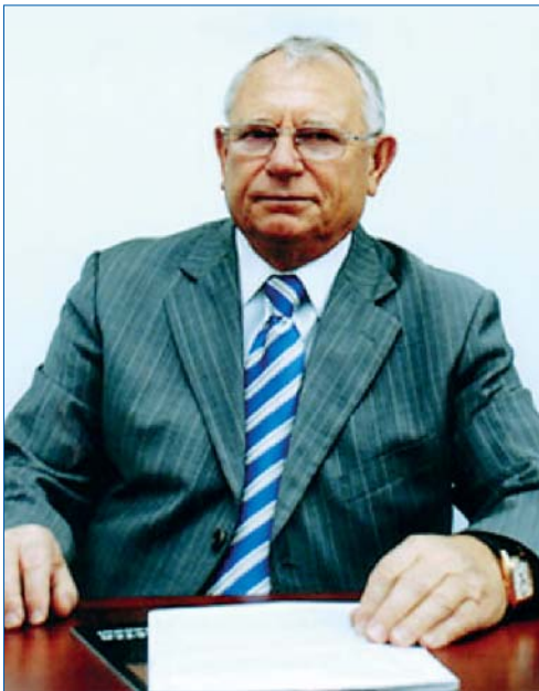
В. І. КОНОНЕНКО, суддя Верховного Суду України і Верховного Суду СРСР (у відставці), заслужений юрист України, суддя вищого кваліфікаційного класу, арбітр Міжнародного комерційного арбітражного суду при Торгово-промисловій палаті України